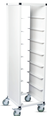
Brickvagn, vitlackerad med vitbetsad täcksida