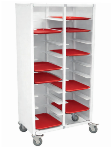
Brickvagn dubbel, vitlackerad med 3 täckta sidor