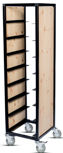
Brickvagn, svartlackerad med naturbetsad täcksida