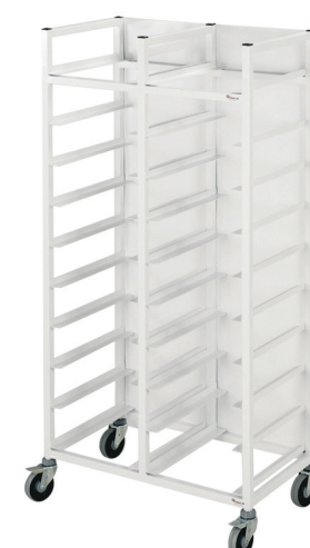
Brickvagn dubbel, vitlackerad med baksida