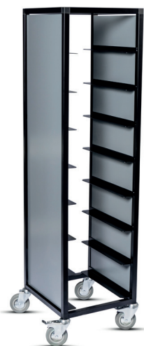
Brickvagn, svartlackerad med mörkgråbetsad täcksida