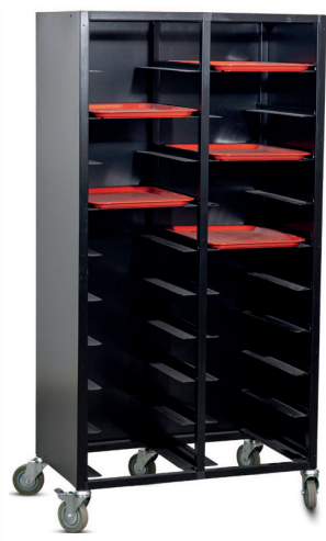
Brickvagn dubbel, svartlackerad med 3 täckta sidor