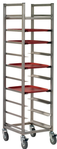
Brickvagn enkel, rostfri