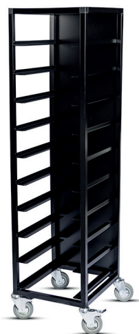
Brickvagn, svartlackerad med baksida