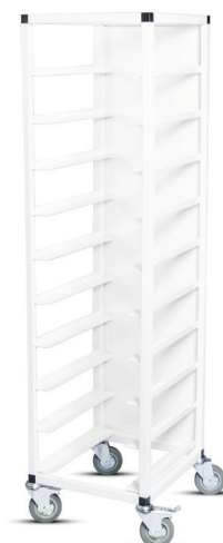
Brickvagn, vitlackerad med baksida