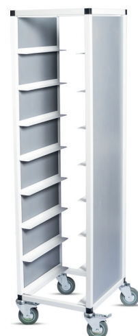
Brickvagn, vitlackerad med ljusgråbetsad täcksida