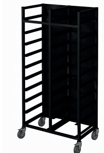
Brickvagn dubbel, svartlackerad med baksida